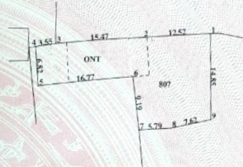
BẢNG LIỆT KÊ TOA ĐỘ GÓC RANH